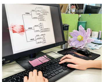
▲电脑端操作思维导图

进入全媒体时代,有趣的视频能引发更广泛的关注。“剪映”“剪辑魔法师”则是非常受欢迎的视频剪辑App,它提供了丰富的视频剪辑工具和特效,如裁剪、拼