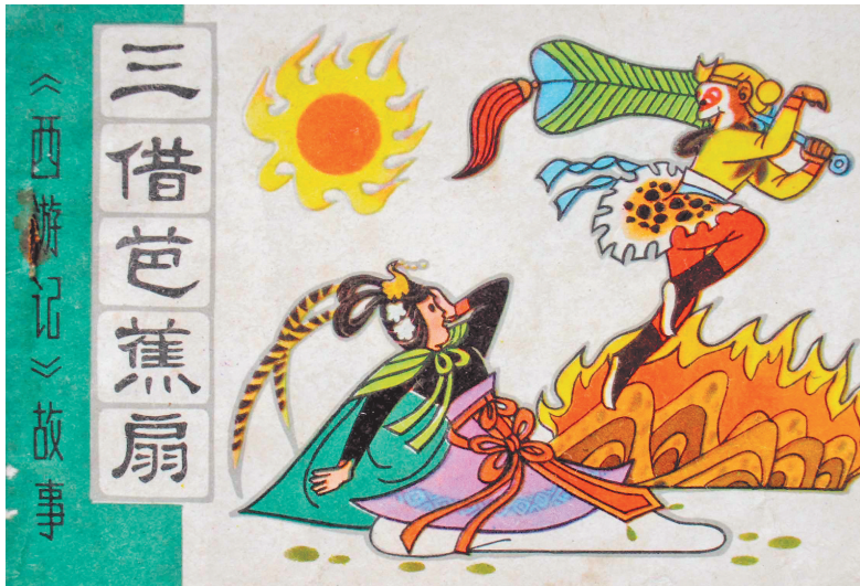
▲连环画《三借芭蕉扇》

提起芭蕉，大家是否会想起《西游记》里铁扇公主那把神奇的芭蕉扇呢？实际上，《西游记》中拥有芭蕉扇的，可不止铁扇公主一个人。