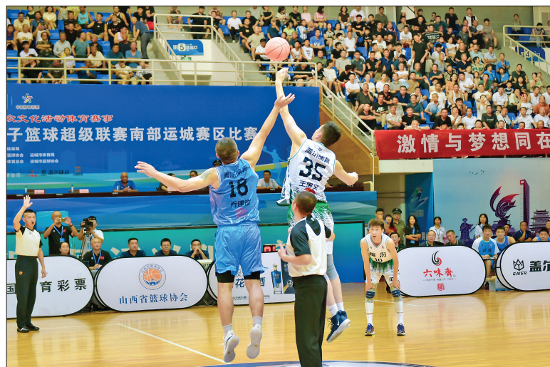
▲比赛现场

本次比赛由山西省体育局主办,山西省篮球协会、运城市体育局承办,运城市体育总会、运城市篮球协会协办,赛事得到体育彩票公益金助力支持。