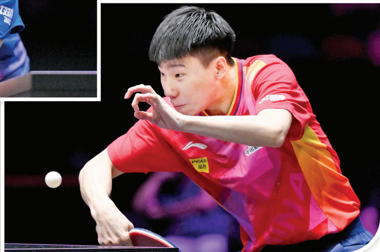
▼9月11日,徐瑛彬在比赛中回球。当日,在2024年世界乒乓球职业大联盟(WTT)澳门冠军赛男子单打首轮比赛中,中国选手徐瑛彬3比2战胜中国台北选手庄智渊,晋级十六强。