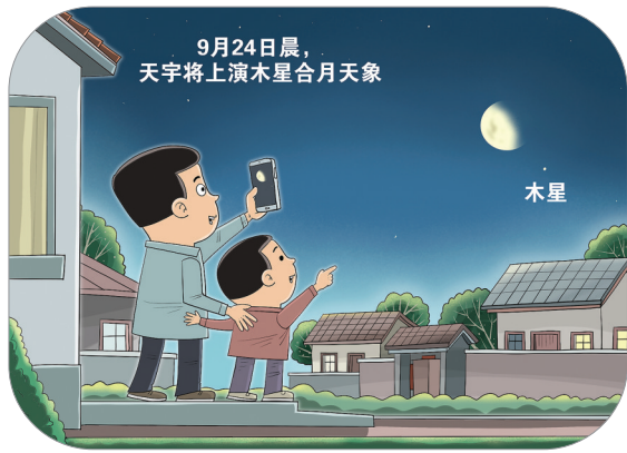
观赏“星月童话” 新华社发 朱慧卿 作

全省38周及以上未分娩孕妇2731人，动员提前入院待产1710人，确保了台风期间未分娩孕妇零死亡、零伤害。“这些成就得益于中国特色妇幼保健服务体系的建立。”中华预防医学会副会长梁晓峰说，我国不断健全以妇幼保健机构和妇女儿童医院为核心，基层医疗卫生机构为基础，大中型综合医院和相关科研教学机构为支撑的妇幼健康服务体系，正朝着全周期、全方位、全过程的目标更进一步。