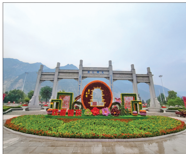
▲永济市舜帝山森林公园门口的绿雕造型美观漂亮

永济市市政公用服务中心相关负责人介绍：“本次花卉展的绿雕造型主要以红、黄两色为主色调，采用国旗、红飘带等元素，搭配种类多样、色彩丰富的时令鲜花，用活泼灵动的动植物形象，展现出市民安居乐业、欣欣向荣的美好生活。同时，还融合了鹤雀楼、唐铁牛等文化旅游元素，不仅展现出我市深厚丰富的历史文化资源，也为市民和游客营造出热烈、独特的国庆氛围。”