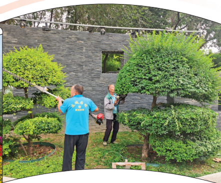
▲园林工人为绿篱修剪造型