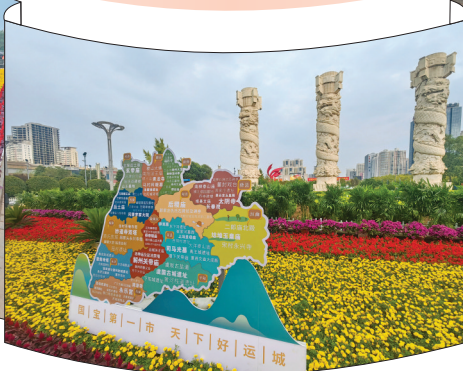
▲南风广场的花卉造型和文化墙展板营造节日气氛