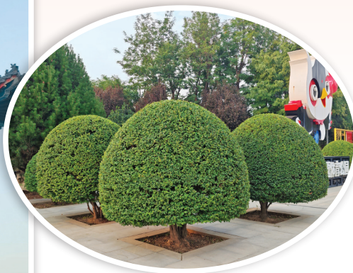
▲公园冬青造型吸人眼球

人精心养护绿植的一个缩影。据该中心相关负责人介绍，为使道路两侧和公园广场的绿地呈现更好的园林景观效果，该中心组织园林工人对绿篱进行整形修剪和杂草清理，并根据天气变化和苗木生长情况进行浇水保绿和花带冲洗工作。同时，还根据不同苗木的具体情况对症下药，做好秋季病虫害防治工作。