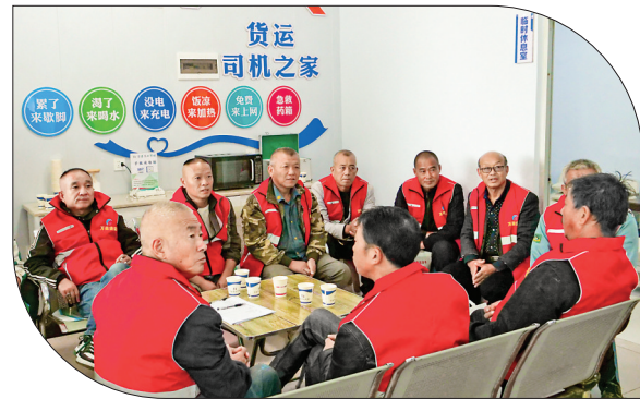
▲司机们在货运零工驿站休息

万荣县人社局相关负责人说，人社部门将用心用情做好货运司机关爱服务，为他们持续提供就业指导、技能培训、劳保维权等免费公益性服务，把货运零工驿站打造成劳动者满意的温暖港湾。