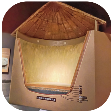
▲嘉仓仓窖结构示意图

不仅如此，古人在对粮食生产及储备问题的思考过程中，也有不少制度化的探索与成果。《礼记·王制》一文就提出“耕三余一”的观点，即按年度计算，年末官府和民间的粮食库存量要相当于当年粮食总产量的三分