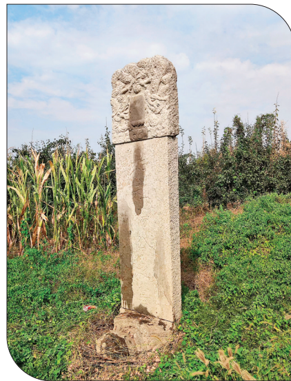
▲清乾隆十二年,累德村杨氏合族所立始祖杨公之墓,碑上部中间书“水源木本”四字。