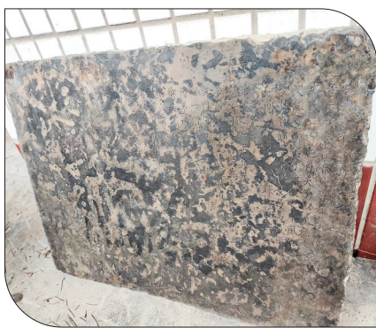
▲“创建纽孝子祠引”碑