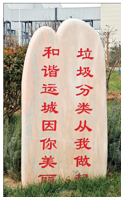
▲厂区内树立的环保标语