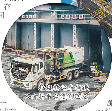
垃圾转运车辆进入卸料平台倾倒垃圾

理餐厨垃圾以外的其他生活垃圾,也是该厂区绿色电能的主要来源。记者在现场看到,垃圾转运车通过厂区全封闭式廊桥驶入负压卸料区,将垃圾倒入储存坑。随后一名垃圾吊操作人员通过操作巨型垃圾吊,将新入场的垃圾进行抓取、堆积,使其自然发酵。另一名工作人员则操作抓斗抓取已经发酵后的垃圾,将其投入焚烧炉进行焚烧发电。