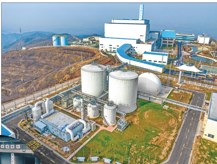
▲运城市生态环保产业园全景