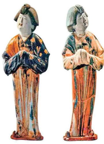
穿披帛的妇女陶俑 (资料图)