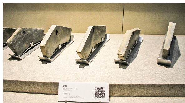
文物名片 主角：石磬 出生时间：东周(公元前770年~公元前256年) 尺寸：长14厘米~50厘米、宽10厘米~12.5厘米、厚2厘米~3厘米 藏宝地：运城博物馆