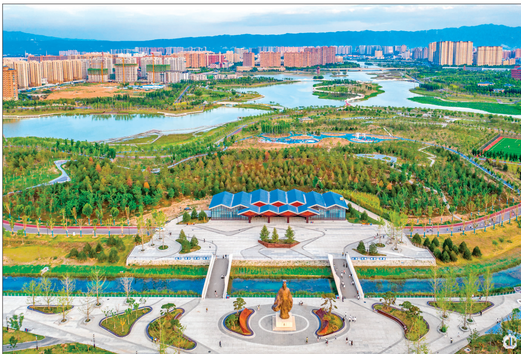
①新建公园让生活更美好

老街换新颜，出行更舒心。今年以来，我市持续深化地下管网攻坚行动，“七合一”雨污分流及防洪排涝提