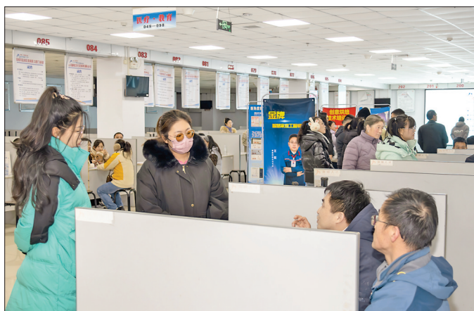
◀求职者与招聘负责人交流

“你好，想找什么工作，可以过来了解一下。”招聘现场，各用人单位招聘负责人也纷纷走出展位，通过发放宣传资料、现场讲解等方式推介优质岗位，积极招揽人才，面对面为求职者答疑解惑。部分用人单位招聘负责人表示，年后是招聘求职的高峰