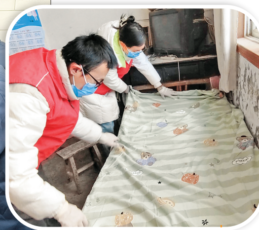
▲收拾屋子迎新年 ◀收到爱心慰问品