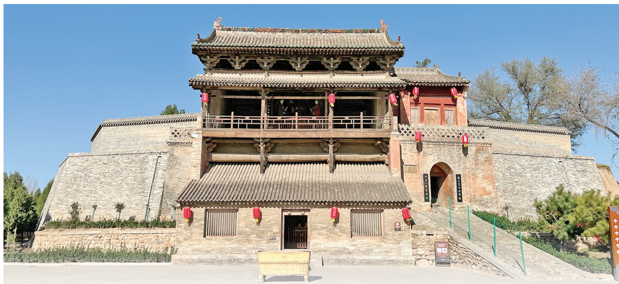
▲新绛白台寺三滴法藏阁

白台寺源远流长，始建不详，历经唐、金、元等朝代的精心修缮，每一次的雕琢都为它注入了新的活力与韵味，承载着千年的风雨洗礼与文化传承。