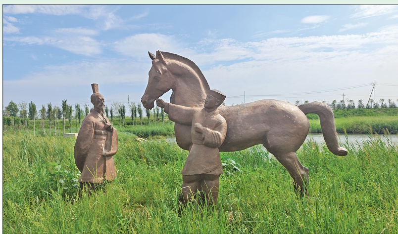
▲河东成语典故园「伯乐一顾」雕塑

因受秦穆公之命，伯乐在冀州挑选良马。当时，虞国国君亦爱好马，也请他来选马。伯乐来到贩运解盐的虞坂古道上，发现普通的马一天拉盐只能走一趟，而有一匹马一天能走三趟。由于载重多、路滑，这匹马被困车下，车夫不停