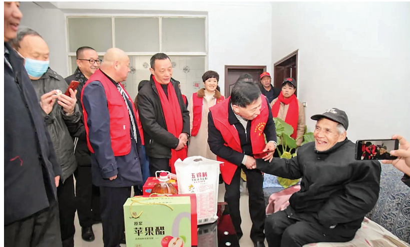
慰问传递关怀 (资料图)

乡村、景区及各大中专院校等,都有研究会志愿者的身影。研究会开展“德孝文化进万家”“德孝文化进乡村”等活动,通过德孝文化主题讲座、书画展、研讨会等形式,向人们传递德孝理念,提高公众对德孝文化的认知和理解。