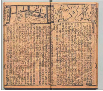
▲明刊本《新镌全像西游记》中哪吒大战孙悟空