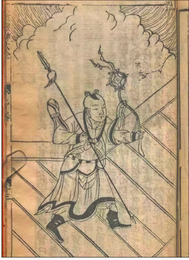
▲清刊本《三教源流搜神大全》中的哪吒画像

《封神演义》中的哪吒天真活泼、自由反叛，拥有着勇猛无敌的战斗力，融合了神话、伦理与英雄主义，成为影视、文学和民间信仰中的经典角色。