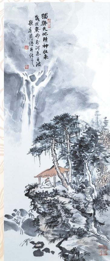
▲独与天地精神往来