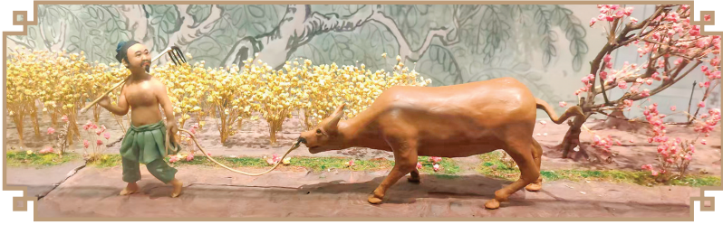
▲万荣薛瑄纪念馆“农夫牵牛”塑像