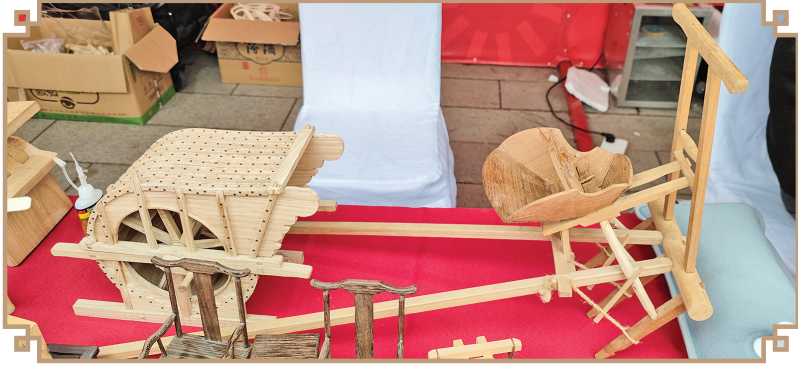
▲运城博物馆“非遗市集”中的古代农具模型