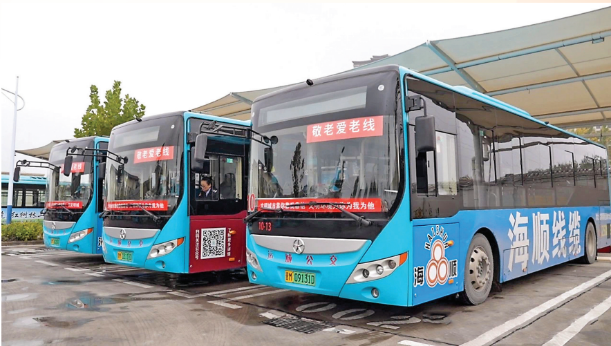
▲敬老爱老线公交车

与此同时，该公司积极落实乘车优惠政策，为65岁以上老人办理免费乘车卡。在市政务中心专门设立窗口，2024年共办理敬老卡9597张，敬老卡保有量达10.5万余张。不仅如此，该公司还与支付宝携手合作，联合推出“运城公交电子敬老卡”业务，如同为老年人送上一把便捷的数字钥匙，满足他们线上办理及年检的需求，2024年共办