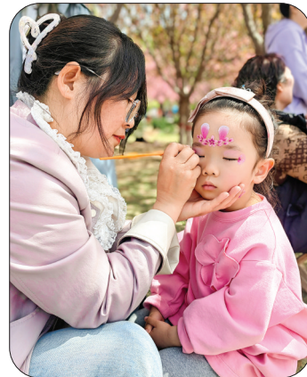
◀ 赏樱之余画个「彩妆」