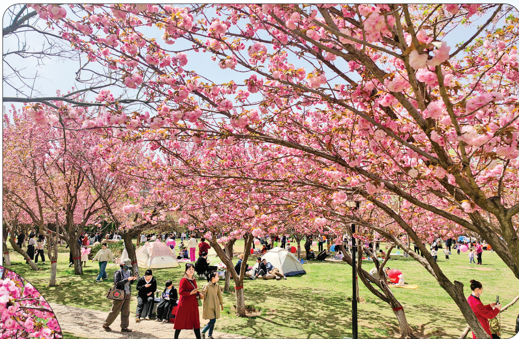
◀ 樱花园里露营踏春

樱花之美,在于文明观赏!樱花从盛开时的绚烂到凋零的浪漫,是一场生命流动的诉说。樱花花期大约只有半个月,想要赏樱的市民,赶紧安排一次赏花之旅!同时,为保障樱花的景观效果,在公园赏樱期间,公园工作人员会劝导规范一些不文明行为。樱花之美,需要每一名观赏者来呵护。希望广大市民和游客在游园期间,切莫随意折花、爬树、摇动花木等,文明游园,让樱花之美成为城市里最持久、最浪漫、最文明的美。