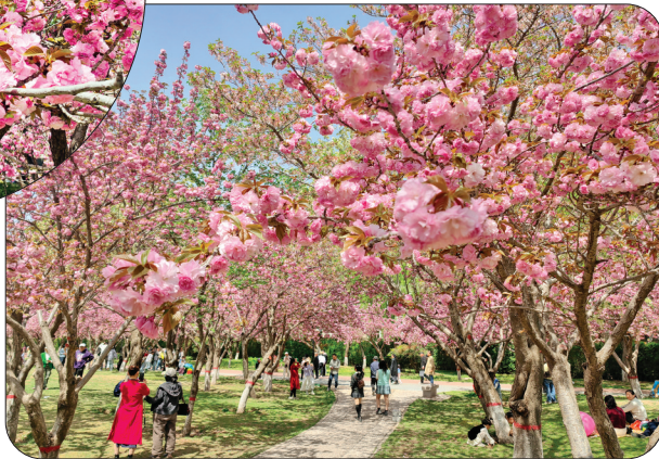
◀ 漫步樱花树下打卡拍照