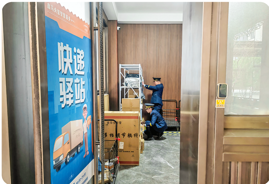
▲物管人员将快递分类入库

在小区快递驿站走访时，两名物业工作人员正在货架前进行快递出库工作，准备为1号楼业主配送快递。一名工