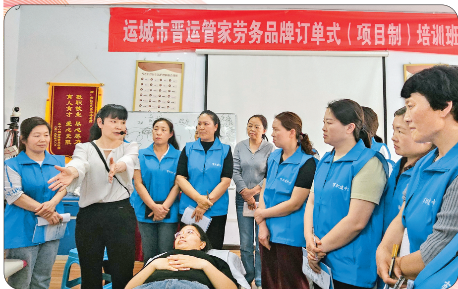
▲订单式培训促就业