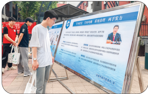
▲学生了解节水政策知识