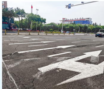
复铺前的路面现状