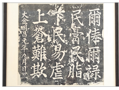
▲“戒石铭”刻石,金明昌元年刻,现存芮城县博物馆。