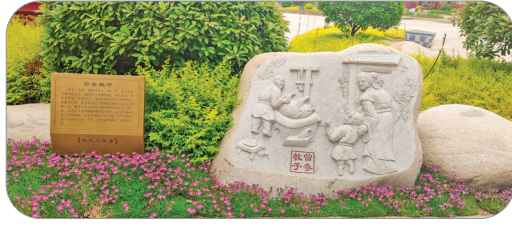
▲运城市鼎鑫华府小区“曾参教子”石雕