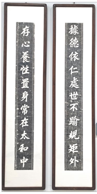
▲民国时期,闻喜县呖底镇康村雷氏宅院门柱联:“据德依仁处世不逾规矩外,存心养性置身常在太和中。”

监察制度。秦时中央设立御史大夫,负责监察百官和管理天下典册图集。西汉在秦制的基础上,构建了以御史台为核心的、从中央至地方上下相维的较为完整的监察体制。唐朝时形成了具有独立司法权的监察机关——御史台,其职能主要是考察官员的政绩和操守,弹劾百官违法乱纪行为。御史台从五代