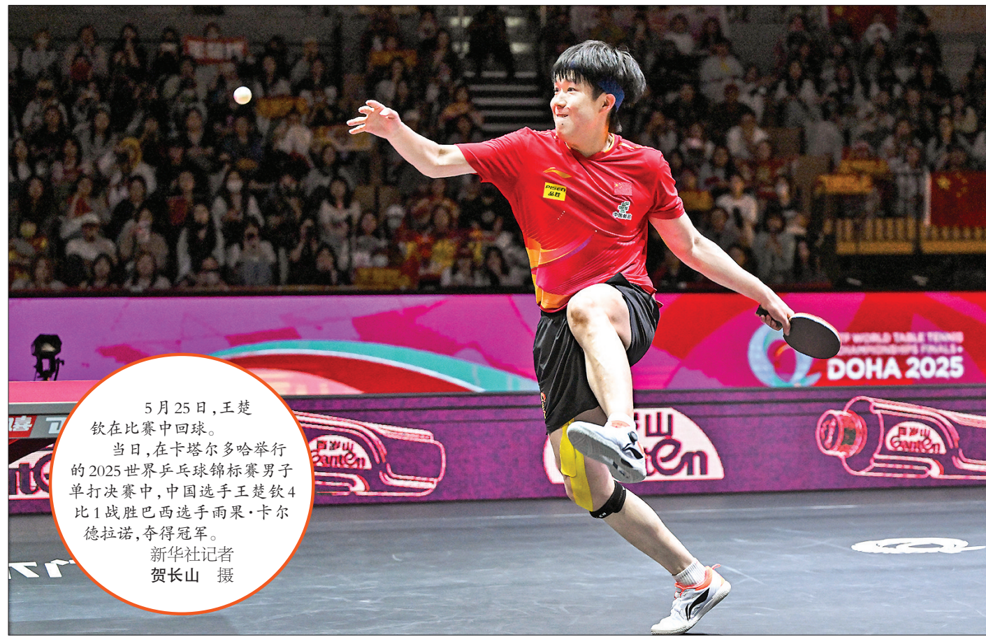
5月25日，王楚钦在比赛中回球。 当日，在卡塔尔多哈举行的2025世界乒乓球锦标赛男子单打决赛中，中国选手王楚钦4比1战胜巴西选手雨果·卡尔德拉诺，夺得冠军。

我国夏季粮油陆续进入收获时节。农业农村部24日最新消息显示，截至目前，冬小麦渐次开镰，冬油菜收获已超八成。