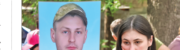
▲5月23日，乌克兰民众举着一名失踪军人的照片寻求帮助。 乌克兰总统泽连斯基23日在社交媒体发文说，乌克兰和俄罗斯当天进行了“千人”换俘计划第一阶段的人员交换，共有390名乌方人员获释回国。