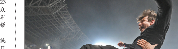
▲5月23日，那不勒斯队球员将主教练孔蒂(上)抛起，庆祝夺冠。 当日，在2024~2025赛季意大利足球甲级联赛第38轮比赛中，那不勒斯队主场2比0战胜卡利亚里队，从而以1分优势力压国际米兰，夺得本赛季意甲冠军。