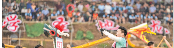
▲5月25日，参赛队伍在比赛中。 当日，“国家非遗道州龙船传统赛”在湖南永州道县潇水水域开赛，吸引了当地近200支龙舟队5000余人同台竞技，备极竞渡，迎接端午节的到来。