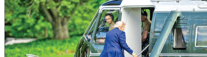
▲5月23日，美国总统特朗普登机离开华盛顿白宫。 美国总统特朗普23日在白宫说，韩国三星电子公司和其他生产手机的企业也将面临关税。当天早些时候，他曾在社交媒体上称，凡是在国外制造并在美国销售的苹果手机，应该面临至少25%的关税。