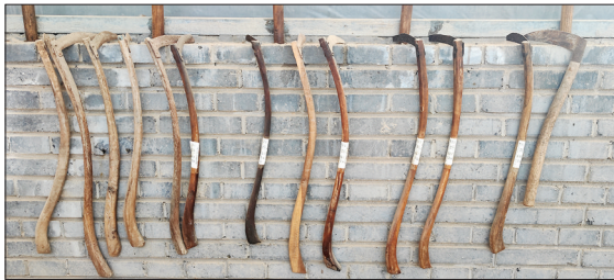
▲临猗县大嵋山农耕文化博物馆展出的镰刀