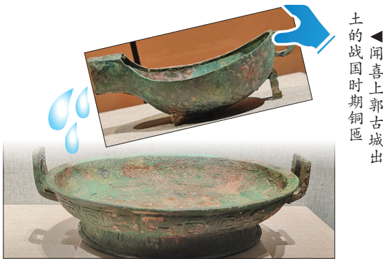
▲垣曲北白鹅墓地出土的春秋时期铜盘

古人很早就意识到,用流动的水洗手、洗脸要比用静水洗卫生得多。所以,古人就研究出了一套流动水洗手的器具和方法。一人在上面拿着容器倒净水,另一人接着倒出来的水流洗手,然后下面有一个盘子或水盆再接着洗过手的脏水。在上面盛净水的容器叫作“匜”,在下面接脏水的容器,叫作“盘”。(《兰州晨报》)