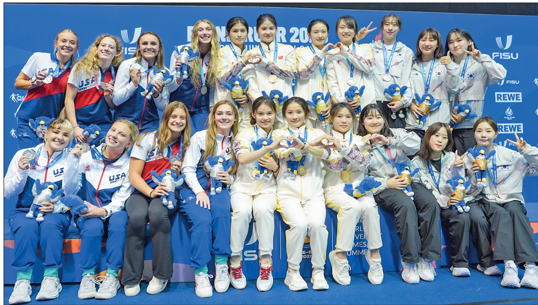
▼7月23日,冠军中国队(中)、亚军美国队(左)和季军韩国队在颁奖仪式上。 当日,在德国柏林举行的2025年莱茵-鲁尔世界大学生夏季运动会中,中国队夺得跳水项目女子团体金牌。