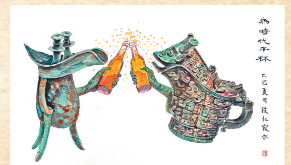
▲为时代干杯 段红霞 作