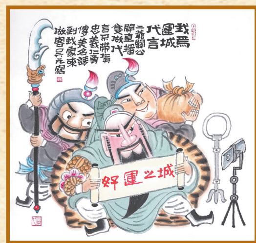
▲我为运城代言 卫吴元 作