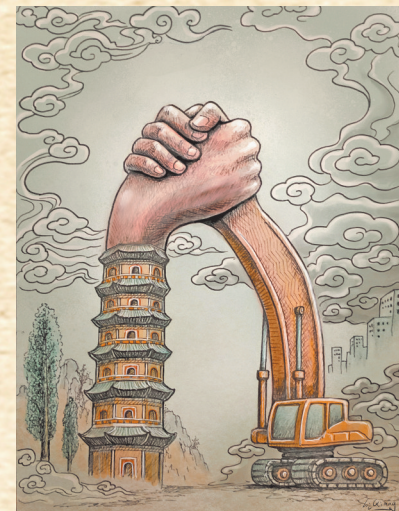
▲“较量” 刘强 作