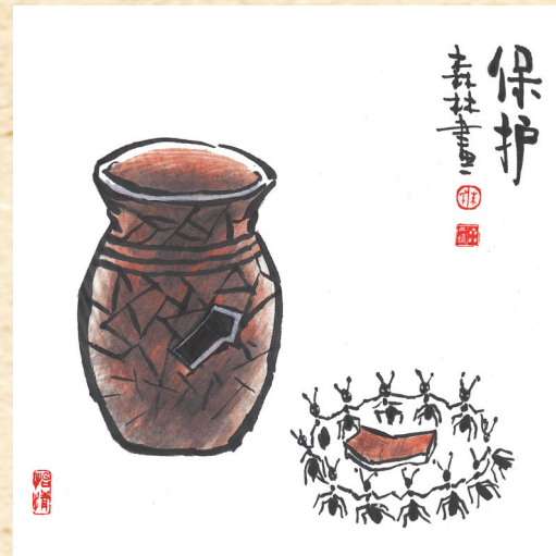
▲保护 朱森林 作