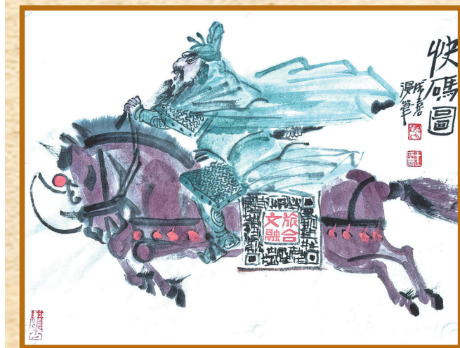
▲快“码”图 王成喜 作