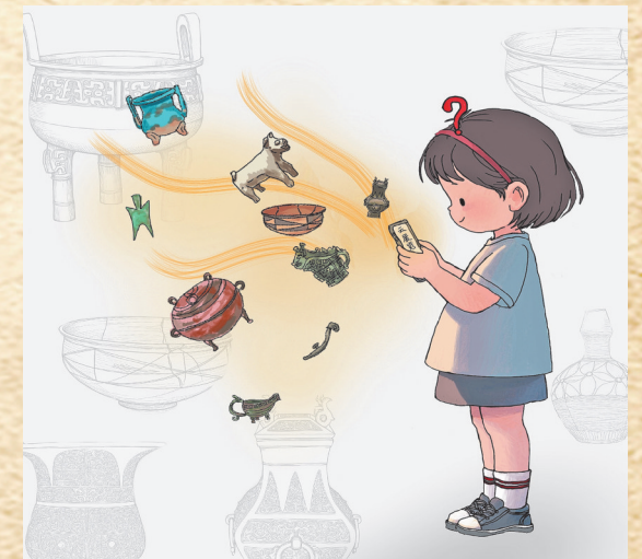
▲云展览 李涵 作