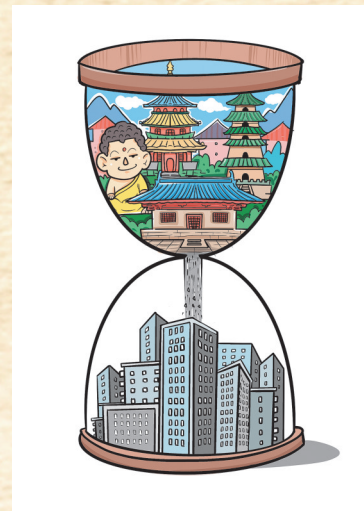
▲“止漏” 郝晶晶 作