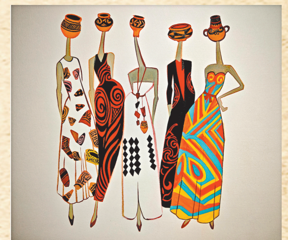
▲东庄彩陶的时尚大秀 戴培诚 作