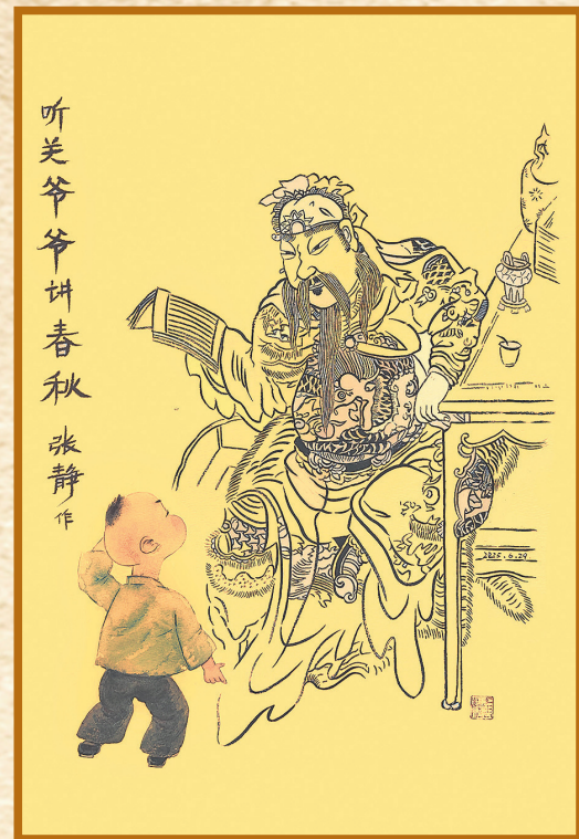
▲听关爷爷讲春秋 张静 作