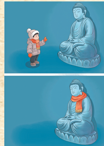
▲给您围上 傅灿 作