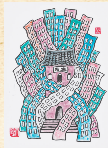
▲“纠缠” 单继新 作