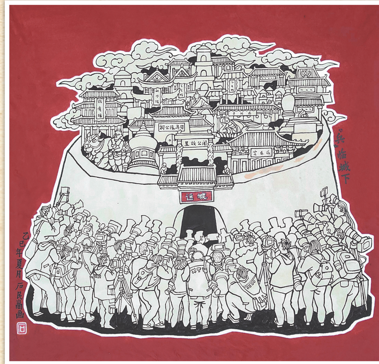
▲“兵”临城下 石民岗 作