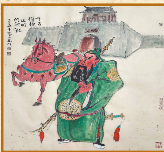
▲千古楷模,运城的骄傲。 高永忠 作