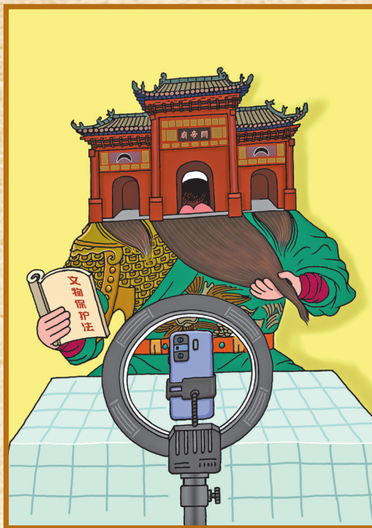
▲新“网红” 王真 作