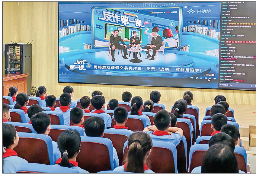
▲师生们观看网络安全相关视频

市教育局相关负责人表示,将结合各校实际情况,持续加大网络安全宣传教育的力度,普及网络安全知识与技能,不断丰富网络安全教育的内容和形式,推动网络安全宣传走深走实。