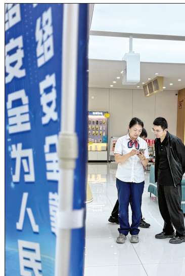
▲联通红旗东街营业厅工作人员向顾客宣传反诈知识