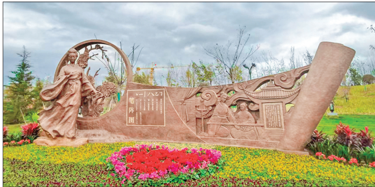
▲夏县白沙河公园内的卫夫人及《笔阵图》雕塑