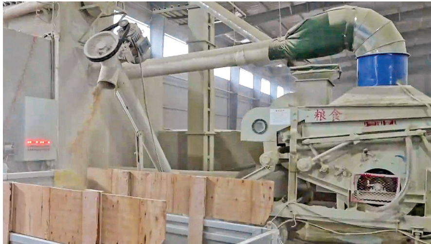
▲农机助力,秋粮归仓。

在垣曲县,科技护粮成为秋收新亮点。该县粮食产地烘干设施及应急救援体系建设项目近日投入运行,配备干燥机、地磅、输送机、除尘系统等先进设备,