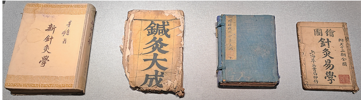
▲运城博物馆《本草撷华 中医药文化器具展》展出的古今针灸书籍