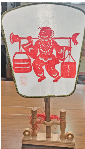
▲运城工艺美术馆展出的“沙和尚”题材扇子工艺品

沙僧这个卷帘大将，应该不是给皇帝卷门帘的，而是护卫车架的“马前卒”，权责大致相当于汉代的执金吾。沙僧进了唐僧的取经团队，给唐僧牵马执杖，干的其实是老本行。（《北京晚报》）