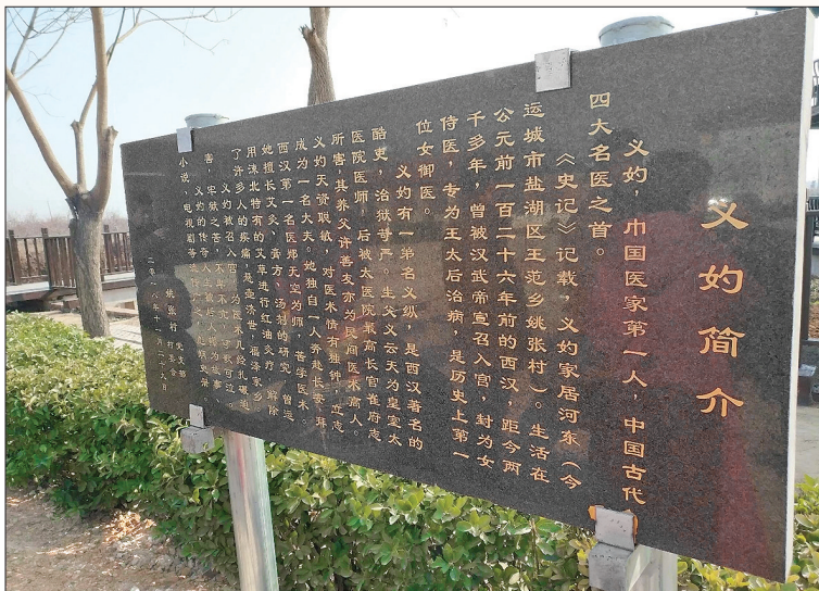
▲姚张村“义妣简介”牌(资料图片)