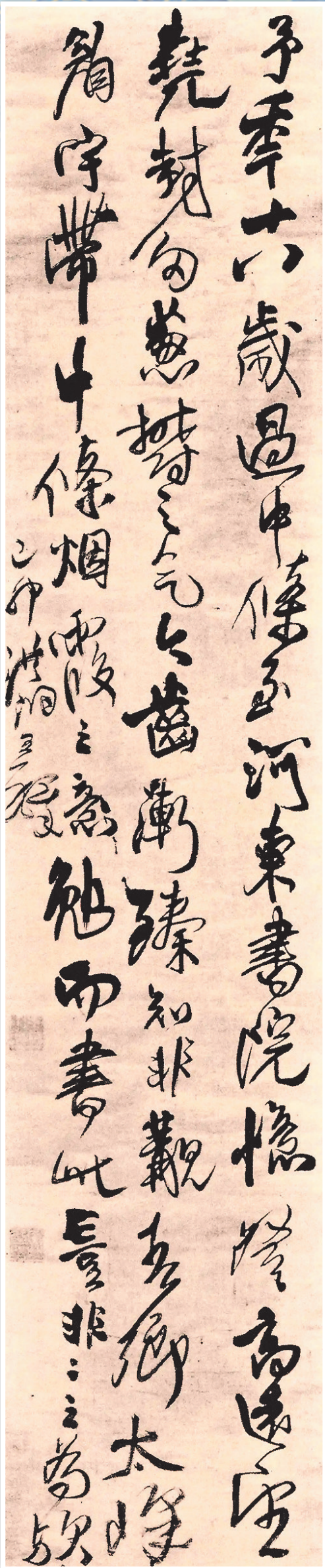
►王铎《忆过中条山语轴》书法

6.引领现代书法展览潮流。当代国展，王铎书法极具视觉冲击力，长盛不衰，一代代书法爱好者朝夕临摹，专业院校及专家理论学术研究成为专门重大课题，成果斐然。