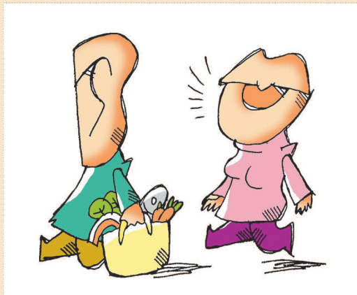
▲老夫老妻 李肖颀(新疆) 作