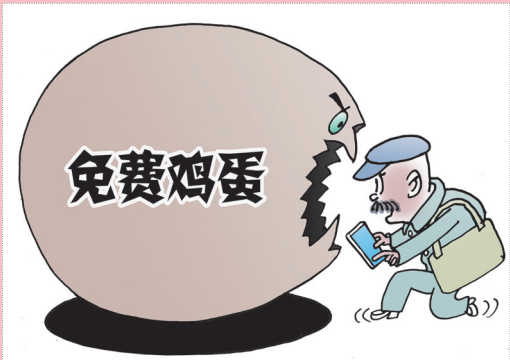
▲“请君入瓮” 蒋跃新(新疆) 作