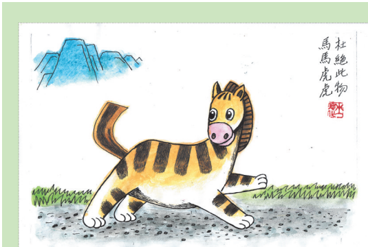
▲杜绝此物 巫德华(河南) 作