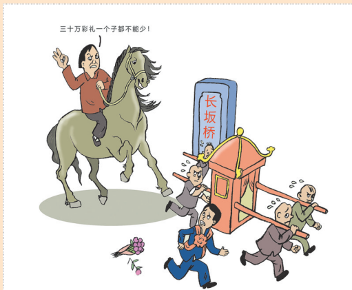
▲无功而返 宋旭升(甘肃) 作