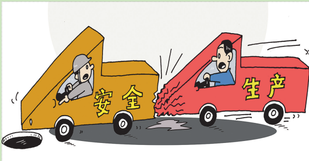
▲“追尾” 韦荣景(广西) 作