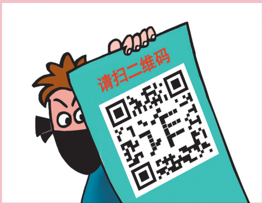
▲害群之“码”——别扫 乔维(黑龙江) 作