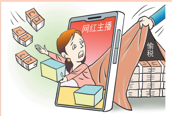
▲曝光 刘志永(天津) 作