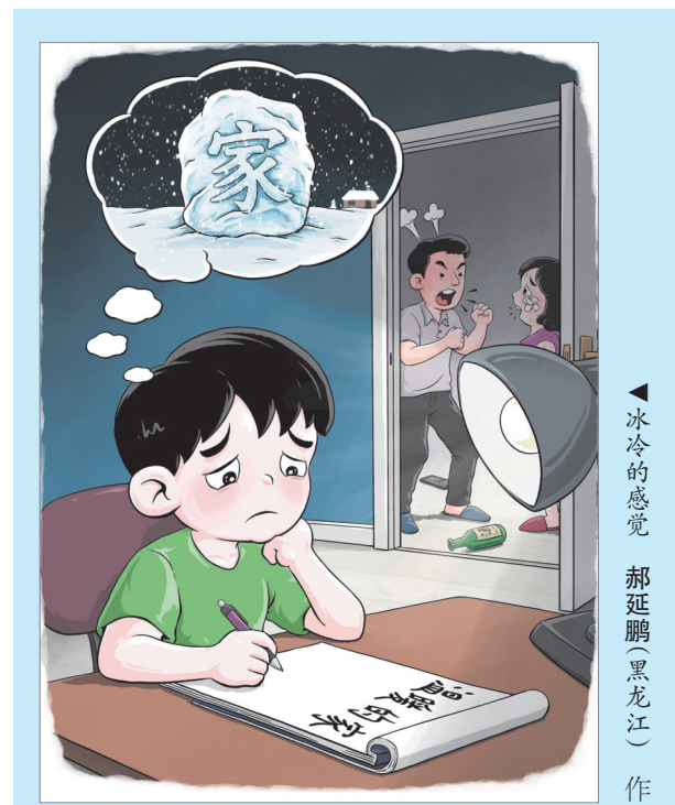
▲冰冷的感觉 郝延鹏(黑龙江) 作