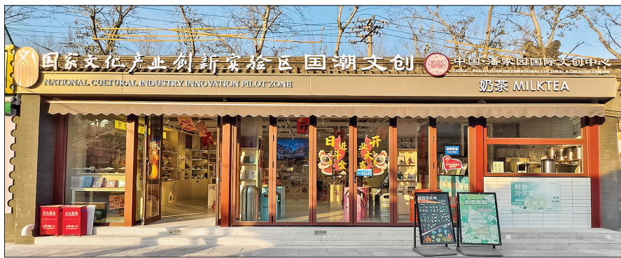
▲国家文创试验区·国潮文创店 中国·潘家园国际文创中心

据有关史料记载,清乾隆年间,北京关帝庙就有116座之多。关公文化系列文创入驻潘家园国际文创中心,是对关公文化的弘扬,也是对关公文化的赓续,意义深远。