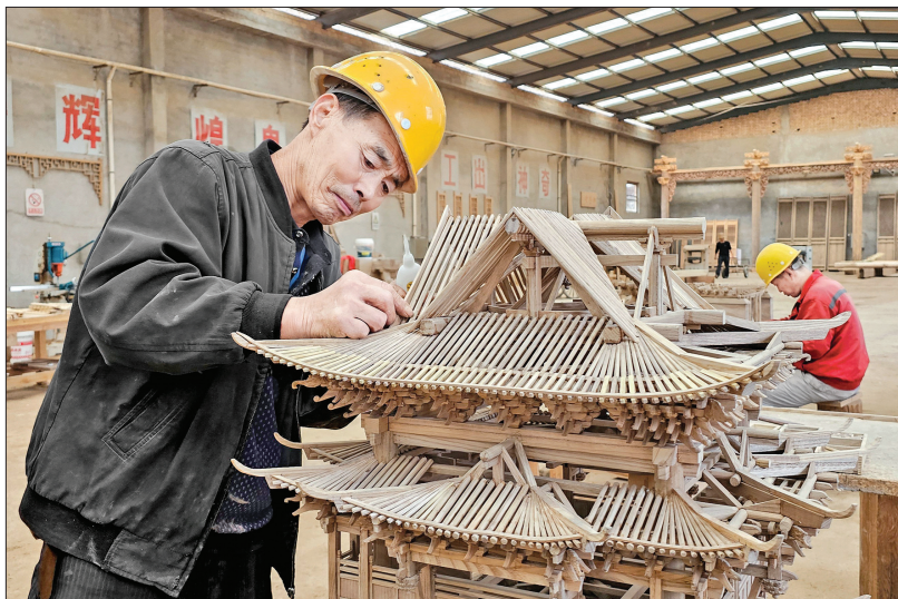
▲工匠制作古建模型

修复国内外各类古建600余处,包括3项“全国十佳文物保护工程”,还参与过上海世博会山西馆建设,具有成熟的工艺手段和丰富的实践经验。